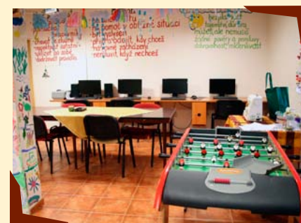
Nížkoprahový klub mládeže Atom (IQ).