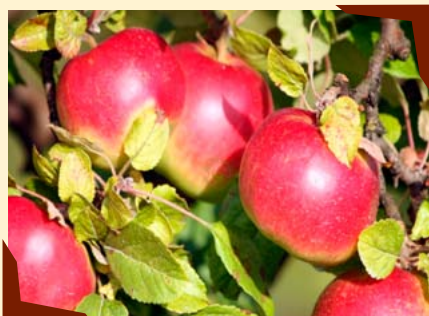
Jablka Idared v BIO kvalitě.

Z 5-ti tun jablek se vyrobily křížaly i bio CRYO jablečný mošt. Tyto i další produkty je možné zakoupit prostřednictvím E-shopu www.zeleny-kosik.cz .