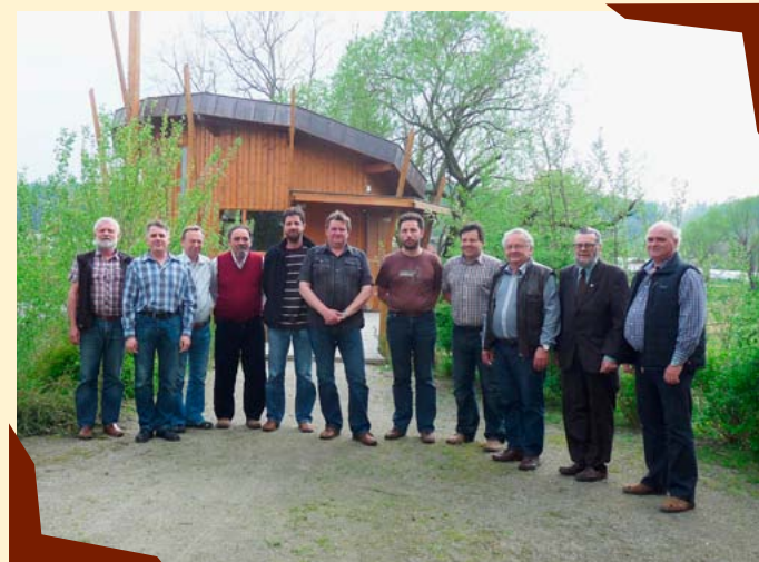
Účastníci členské schůze.