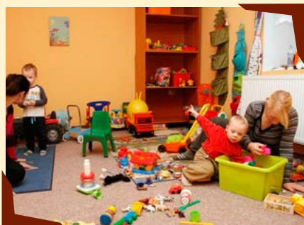
Mateřské centrum Klásek.

Senior klub nabízí pro svou klientelu sociálně – aktivizační služby, podpůrné činnosti a poradenství a to jak ambulantní v místním DPS tak i přímo v terénu. Cílovou skupinou jsou senioři a osoby se zdravotním postižením. Od roku 2013 se realizují sousedská posezení s dechovkou, pravidelné cvičení, tématická tvoření nebo poznávací výlety (např. rozhledna Jarník, plavba lodí, termální lázně Gmund, Bad Fussing aj.)