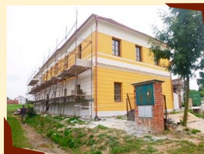
Budova obecné školy.

V roce 2010 spolek POMOC zakoupil objekt bývalé obecní školy v Chrástanech, se záměrem vybudovat zde Dům sociálních služeb. Koupě objektu umožnila spolupráci v partnerském projektu s francouzskou pojišťovnou MSA Domovy MARPA. V rámci partnerství byl převzat model fungování těchto domovů pro seniory. V naší republice byl pod patronátem MZE ČR nazván Domovy KLAS (Klidné a Aktivní Stáří). V roce 2013 byla v rámci dotačního programu MMR přidělena finanční podpora pro výstavbu bytů a rekonstrukce probíhala do konce roku 2014. Nyní jsou tyto čtyři byty zvláštního určení v druhém patře budovy finalizovány a budou v roce 2015, po kolaudaci celého objektu, pronajaty osobám se sníženou soběstačností způsobenou věkem, zdravotním stavem nebo nepříznivou sociální situací. Na podzim roku 2015, bude podle osvědčeného modelu „Dvorce Temelín“ zahájen také zde provoz seniorského klubu, mateřského, nízkoprahového centra pro mládež a fyzioterapeutického centra. V rámci slavnostního otevření celého objektu bude zpřístupněna i opravená příjezdová komunikace. Momentálně je v areálu v provozu chráněná dílna truhlářská se šesti zaměstnanci. V roce 2014 provozoval svou činnost ateliér pro výtvarnou tvorbu, řemesla a další volnočasové aktivity. Ve spolupráci s MAS Vltava o.s. zde probíhaly kurzy lidové tvořivosti, které byly podporovány SZIF - Program rozvoje venkova.