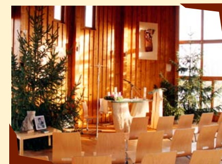
Kaple sv. Anežky České.