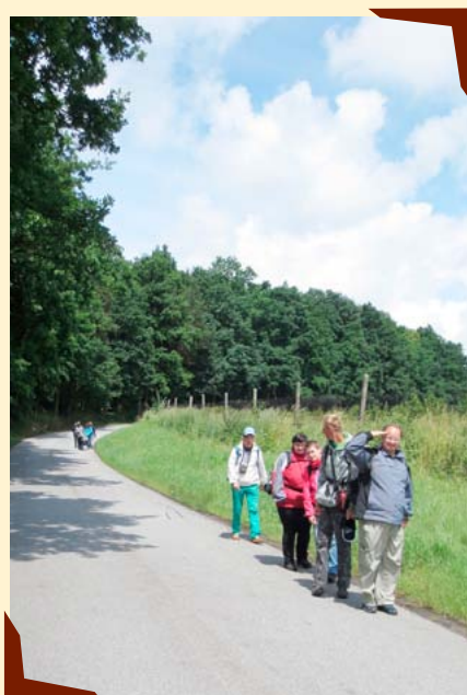
Sociální turistika v praxi.