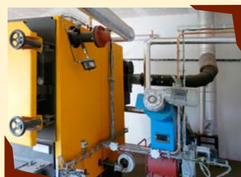
Kotel na biomasu.