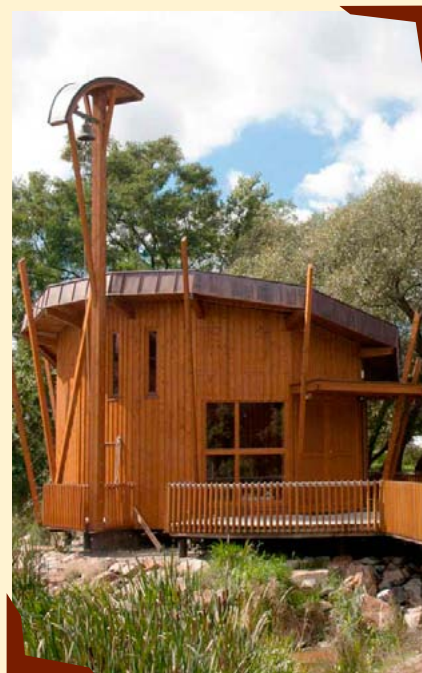
Kaple sv. Anežky České.

U příležitosti pátého výročí vysvěcení místní kaple pak v rámci uvedené edice vznikla i publikace Čihovická kaple sv. Anežky.