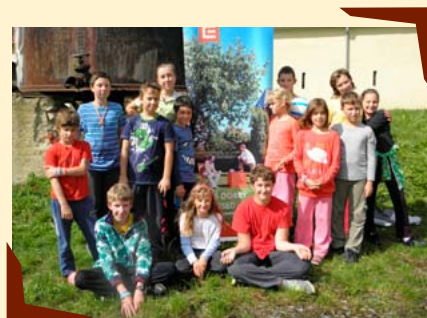
Nížkoprahový klub mládeže Atom (IQ).

V současné době spolek POMOC hledá vhodné zdroje na financování tohoto projektu.