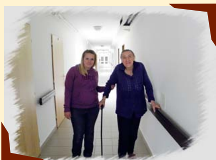
Klienti Domovů Klas se sociálními pracovníky.