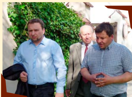
Návštěva ministra zemědělství.