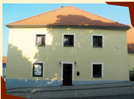
Objekt společnosti Domovy Klas o.p.s.

V roce 2014 se činnost rozšířila o poskytování sociálních služeb – registraci pečovatelské služby a osobní asistenci.