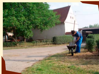
Pomocníci, úklid a údržba.