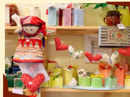
Domov sv. Anežky, o.p.s.

Bližší informace naleznete na www.anezka-tycn.cz či ve Výroční zprávě Domova sv. Anežky, o.p.s. za rok 2014