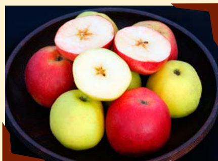
Produkty z Biofarmy.