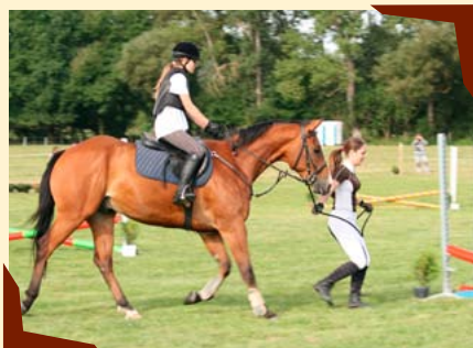
Jezdecké hobby závody