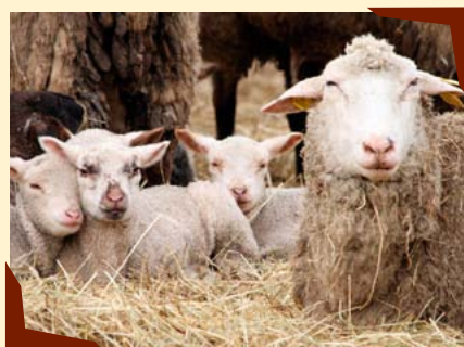
Spolupráce s farmou.

realizace II. etapy pastevního areálu o výměře 30 ha, který je budován s maximálním ohledem na biodiverzitu.