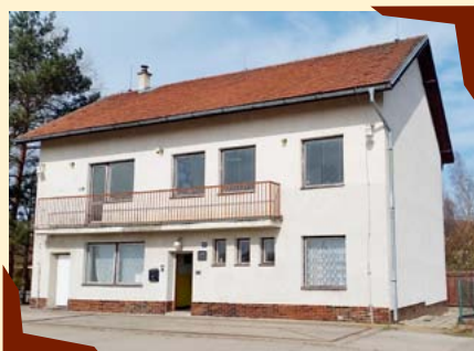
Budova chráněné dílny.