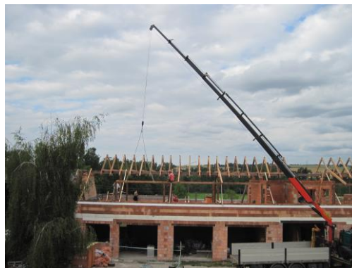
Budování zimních dílen v Čihovicích