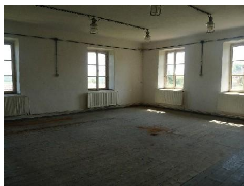
Budování zázemí pro klubovny mateřského centra a senior klubu v Chrást'anech.