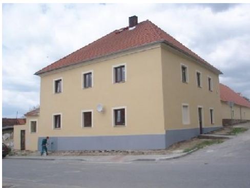
Oprava fasády Domovů Klas v Temelíně