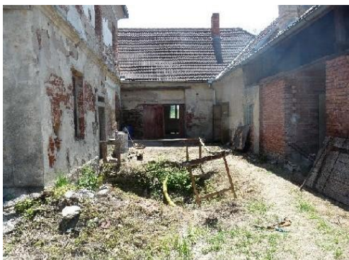
Vyklizení areálu školy v Chrást'anech, která se stane domovem sociálních služeb